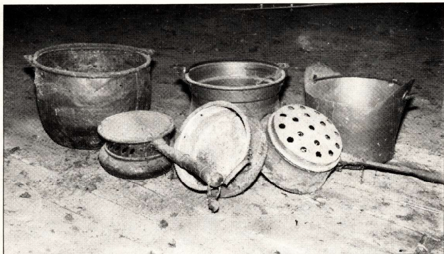
Tipici manufatti del «maiario».

In un angolo il forno, alimentato a carbone di legna, dà un tocco di colore e luce allo scuro laboratorio, ma il calore che ne esce è molto forte: le barre di rame devono raggiun-