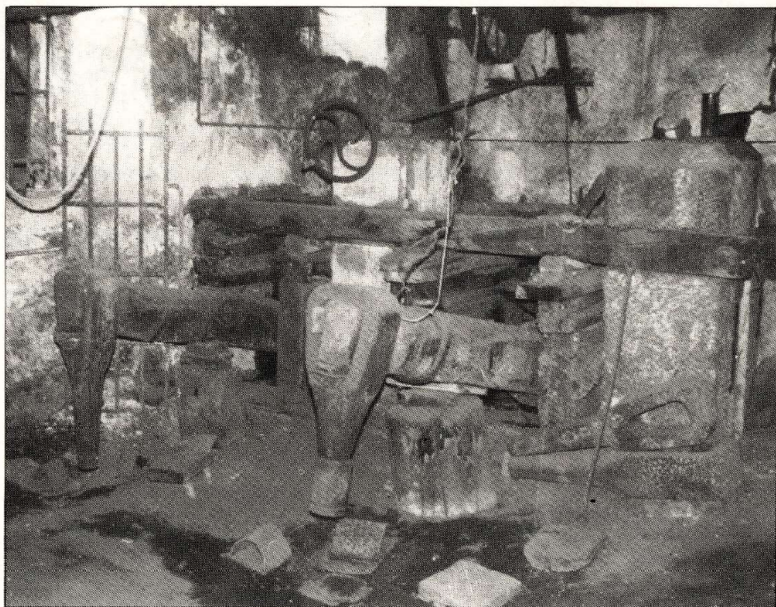
Il maglio mosso dalla ruota idraulica usato per la lavorazione del rame.

Questa volta egli deve fare un paiolo; dopo avergli dato la forma voluta procede con il lavoro in laboratorio. Nell'alto stanzone ci sono: un lungo banco di lavoro, numerosi attrezzi sulle mensole e alle pareti, diversi manufatti da completare. Per il paiolo è ora il momento della