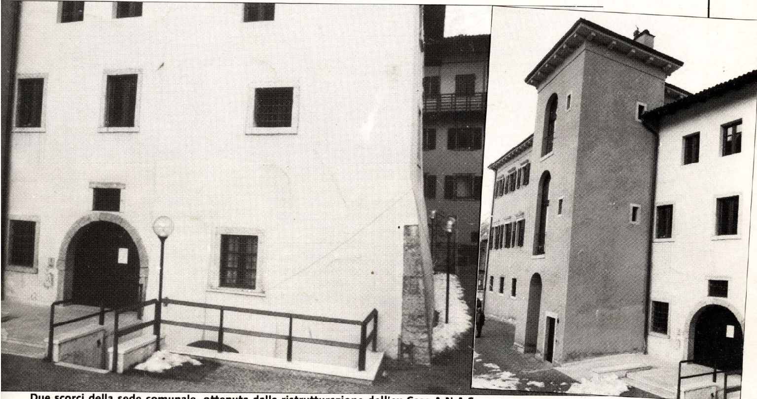
Due scorci della sede comunale, ottenuta dalla ristrutturazione dell'ex Casa A.N.A.S..