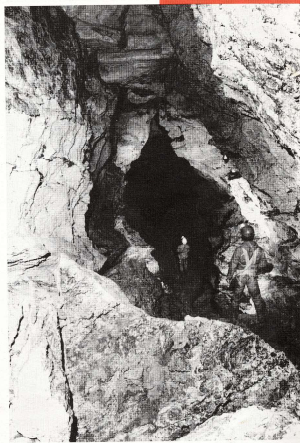
Grotta 1100 ai Gaggi